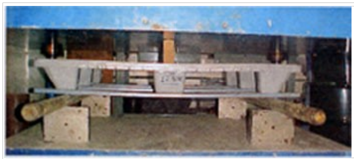
Foto 1 - Vista geral do palete

nove blocos de apoio. Tem três barras tubulares de aço, com seção retangular de 60 x 20 mm e espessura de 1,25 mm, sob cada conjunto de três blocos de apoio paralelos ao lado de 1200 mm, parafusas a cada bloco. A massa total do palete é de 12,5Kg. (Foto 1).